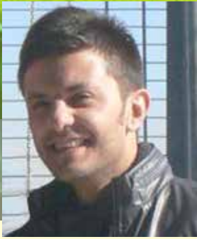
تهیه و تنظیم: سیاوش انصاری