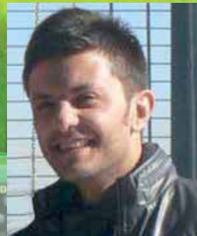
تهیه و تنظیم: سیاوش انصاری