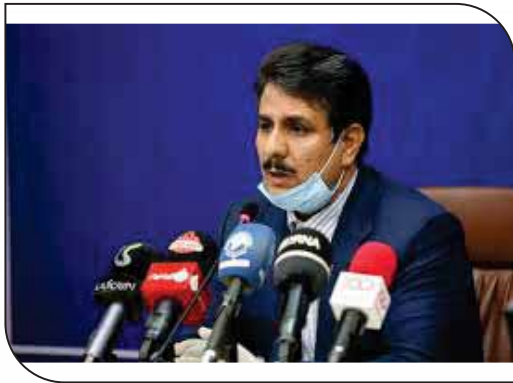
نرخ مصوب کره تعیین شد

وی تاکید کرد: زمانی الگوی کشت توسط کشاورزان اجرا می‌شود که از لحاظ اقتصادی برای آنها توجیه لازم را داشته باشد.